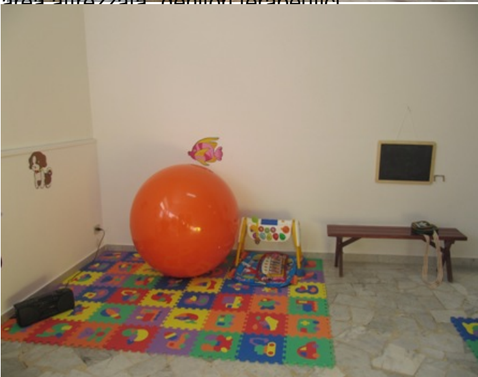
ingresso sede del progetto